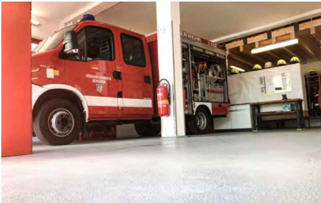
Gerätehaus mit neuer Bodenbeschichtung und renoviert

Die Kosten für die Erneuerung übernahm die VG Monsheim, während die Feuerwehr Mörstadt allerdings in Eigenleistung und mit Geldmitteln des Fördervereins die Gelegenheit eines ausgeräumten Gerätehauses nutzte und die Wände der Fahrzeughalle mit einem frischen Anstrich versah. Dadurch erstrahlt diese nun wieder in neuem Glanz und ist für die nächste Zeit gewappnet.